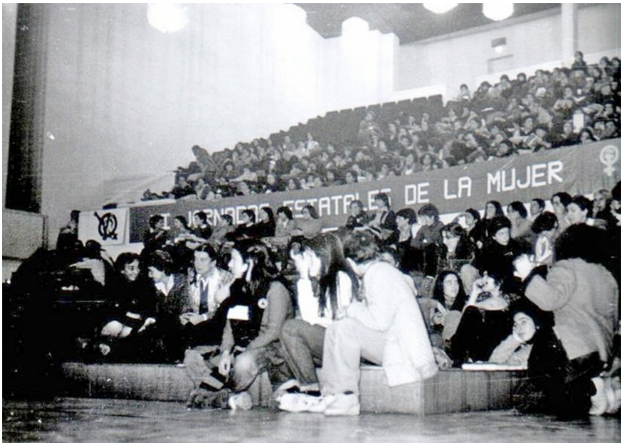
Las jornadas feministas estatales de 1979 se celebraron también en Granada.- Fuente: http://archivo-t.net/

La filósofa francesa participó en las segundas jornadas feministas del Estado español, celebradas en Granada en 1979. La ciudad acogió otra cita histórica en diciembre de 2009. Una década después, recordamos parte de lo abordado aquellos días.