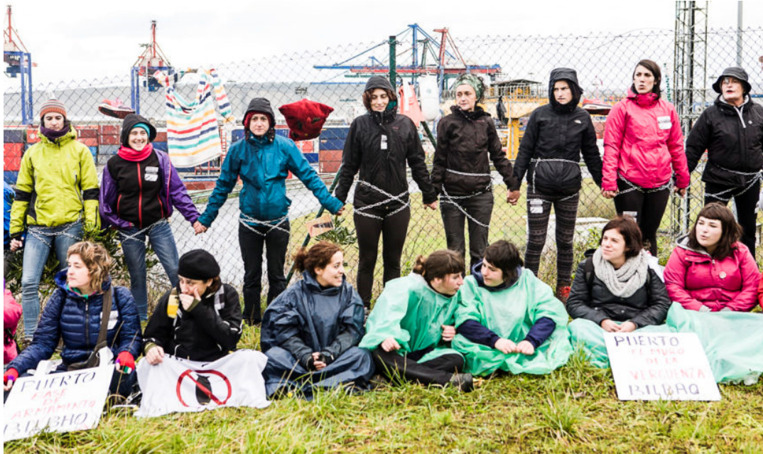
La lluvia y el frío no movió a ninguna de estas mujeres.

“La construcción del muro del Puerto de Bilbao que impide el libre tránsito de personas y se suma al creciente número de fronteras a lo largo de la Unión Europea. Fronteras convertidas en imaginarios de guerra y de destrucción de seres humanos y que además forman parte del negocio de la seguridad”.