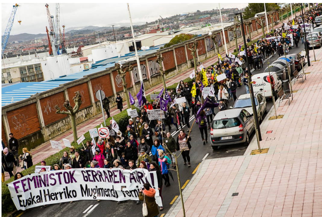
La marcha se hizo en torno al Puerto de Bilbao, en Santurtzi.