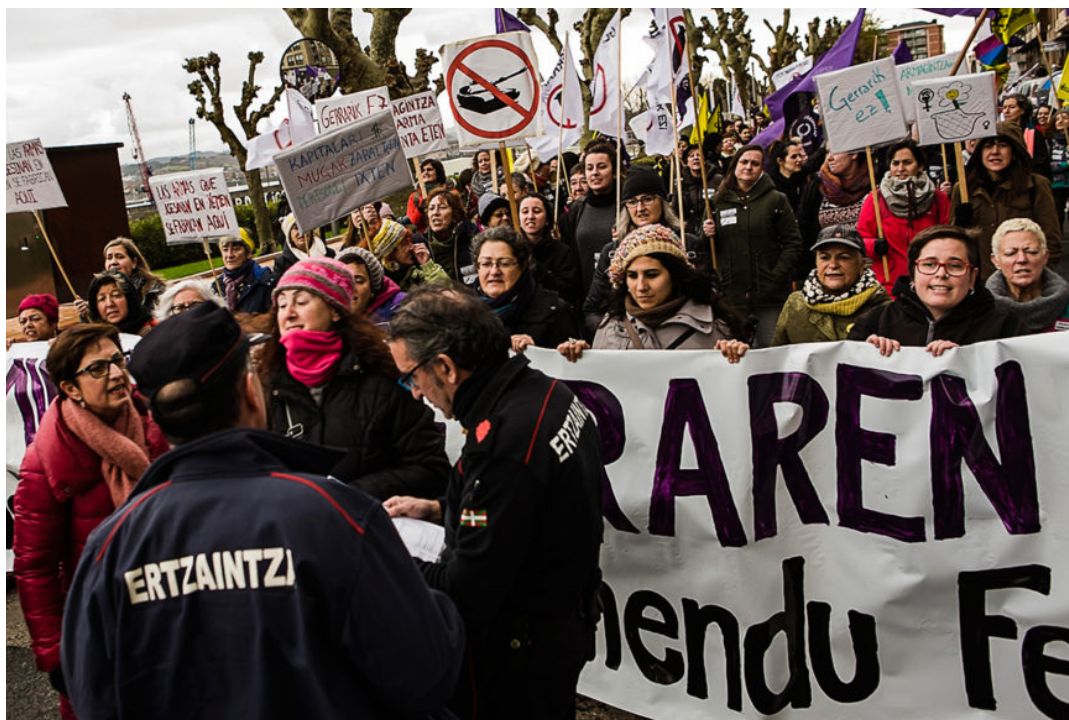
La Ertzaintza apareció una vez empezada la marcha, pidiendo los permisos.

El movimiento feminista denuncia “la utilización de este puerto, mes tras mes, para el transporte de miles de toneladas de armas con destino a Arabia Saudí, donde su régimen dictatorial las usa para reprimir los derechos humanos de su propia población (especialmente las mujeres) y para alimentar guerras como la de Yemen, en la que la población civil está siendo masacrada”.