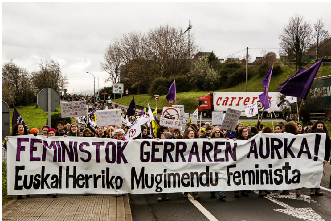
Alrededor de mil personas se manifestaron en Santurtzi contra las guerras.

El movimiento feminista vasco ha clamado contras las guerras, que empiezan en el Puerto de Bilbao, de donde parten barcos con armamento, y contra las fronteras. Estas son algunas de las imágenes que ha dejado una jornada de lucha, reivindicación y unión.