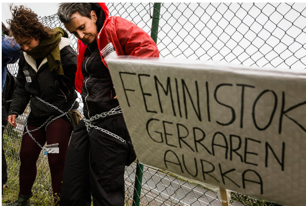
Alrededor de 30 mujeres se encadenaron durante casi una hora frente a la valla del puerto.

El movimiento feminista denuncia “la utilización de este puerto, mes tras mes, para el transporte de miles de toneladas de armas con destino a Arabia Saudí, donde su régimen dictatorial las usa para reprimir los derechos humanos de su propia población (especialmente las mujeres) y para alimentar guerras como la de Yemen, en la que la población civil está siendo masacrada”.