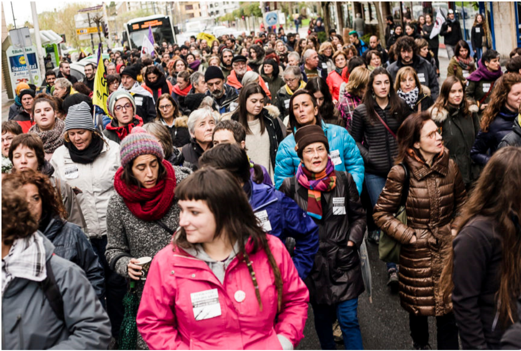
La marcha, entre frío y lluvia, comenzó en las calles de Santurtzi.

*El texto que acompaña a las fotos es el manifiesto leído, en euskera y castellano, al final de la marcha.