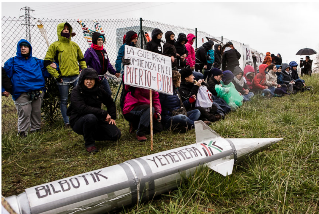
Mientras varias mujeres hacían la acción, la marcha continuó.

El manifiesto leído al final de la marcha terminaba: “Nos gustaría que todas las medidas que el Gobierno Vasco y la Autoridad Portuaria dedica a proteger las mercancías del puerto se dedicaran al desarrollo de políticas públicas, a combatir la violencia machista, o a la acogida de personas desplazadas forzadas. Queremos un país que ponga en el centro de todas las propuestas, incluidas las económicas, los derechos humanos”.