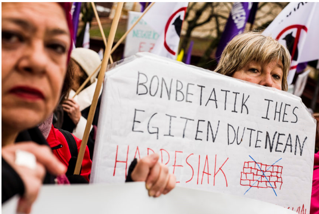
Varias mujeres portaban carteles.

El manifiesto leído al final de la marcha terminaba: “Nos gustaría que todas las medidas que el Gobierno Vasco y la Autoridad Portuaria dedica a proteger las mercancías del puerto se dedicaran al desarrollo de políticas públicas, a combatir la violencia machista, o a la acogida de personas desplazadas forzadas. Queremos un país que ponga en el centro de todas las propuestas, incluidas las económicas, los derechos humanos”.