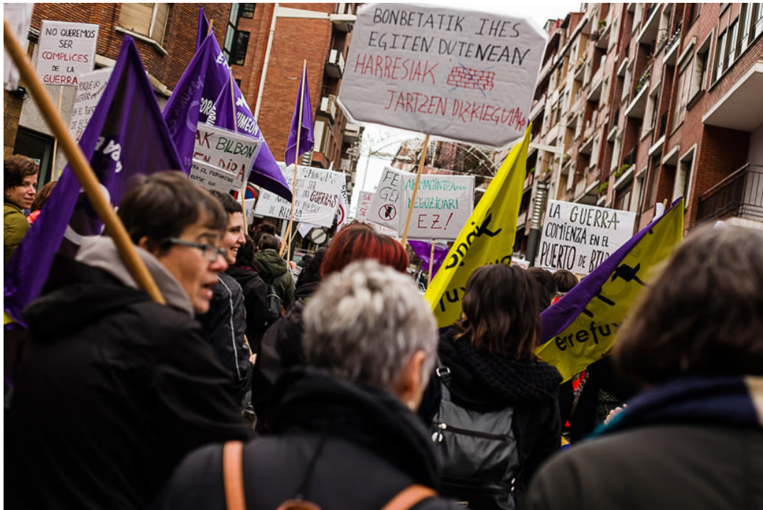
Diversos colectivos se sumaron a la marcha.

“Nos manifestamos en el puerto de Bilbao siguiendo la estela de nuestra propia historia y queremos traer a la memoria a las mujeres del Greenham Common que en 1981, y durante diez años, organizaron un campamento de paz para protestar contra la decisión del gobierno británico de permitir misiles crucero en la base de la OTAN situada en esa localidad. El primer bloqueo de la base