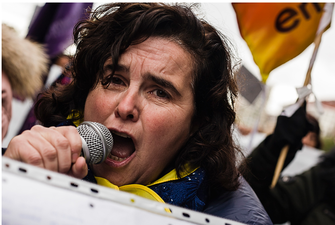
Los cánticos contra las guerras y las fronteras fueron los principales lemas gritados.