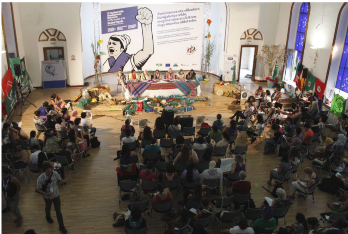
Más de 150 mujeres han participado en la V Asamblea de Mujeres de la Vía Campesina.

La V Asamblea de Mujeres de la Vía Campesina acoge el reto de trabajar por un feminismo campesino y popular.