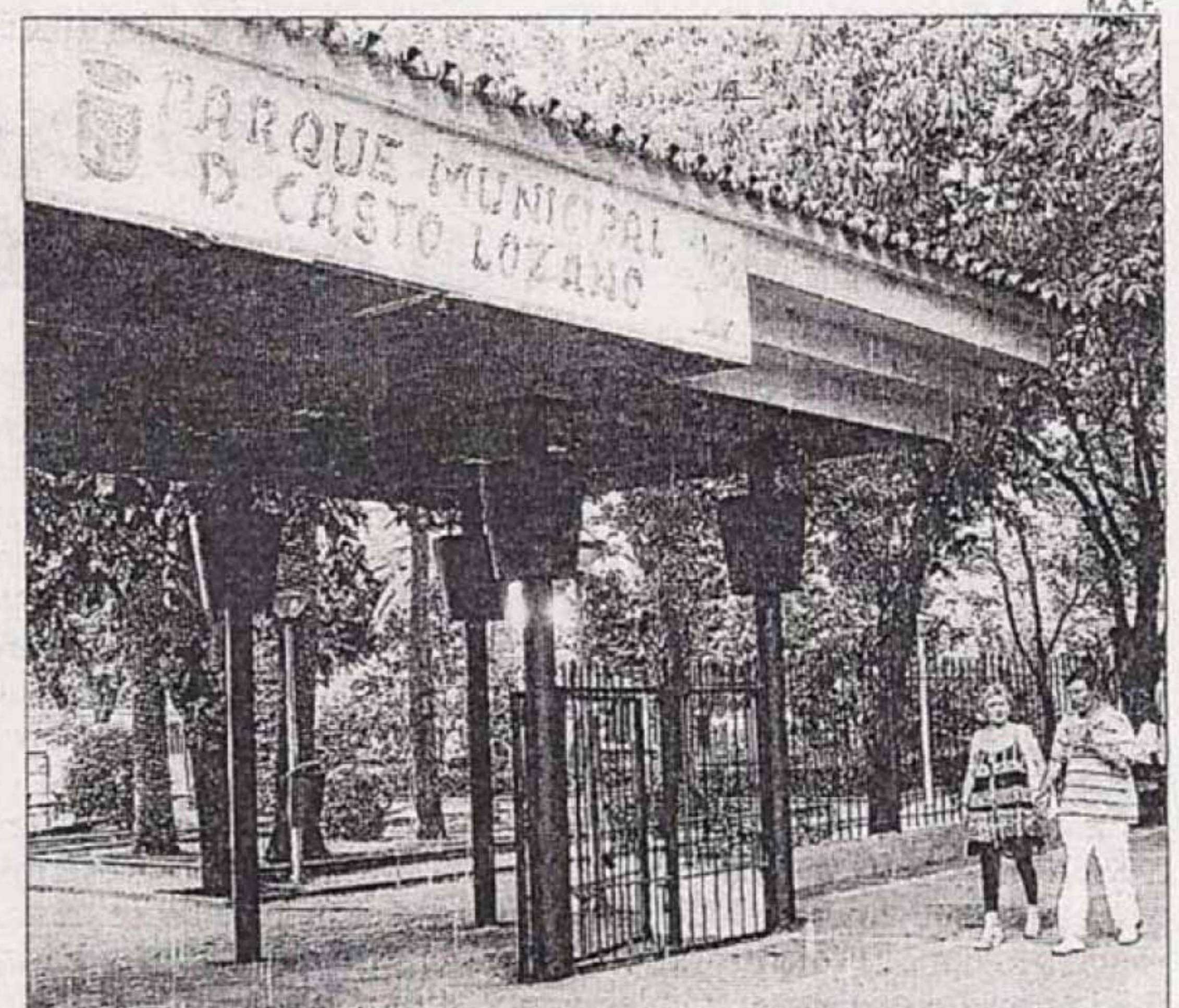
►► Parque de Navalmoral donde se celebran las ferias.

Según el proyecto de Iberforum, el encuentro de artesanos tendrá entre 30 y 40 puestos mientras que la Feria de Formación, entre 15 y 20. Además de la coordinación y selección de expositores, la empresa con sede en Malpartida de Cáceres se encargará de los proyectos, espectáculos y actuaciones paralelas a las ferias, que se celebrarán en el parque municipal. ≡