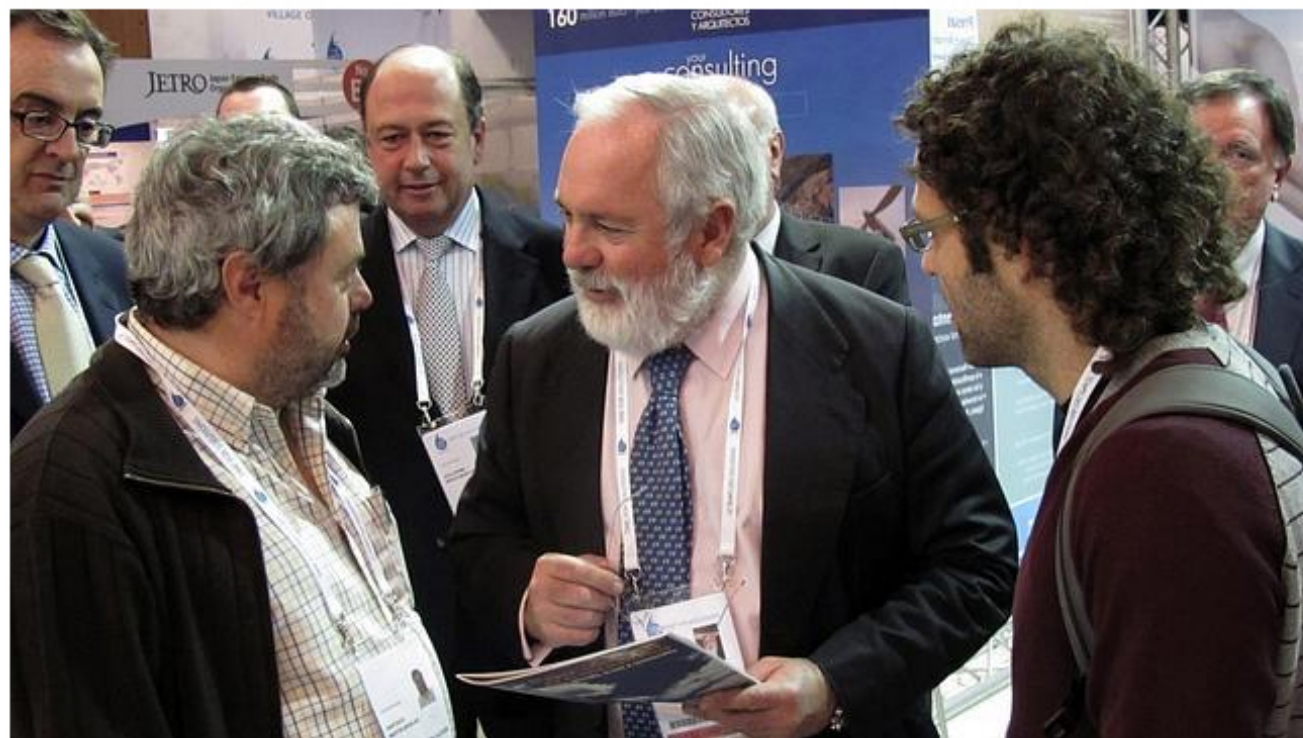
El ministro Arias Cañete conversa con representantes de Ecologistas en Acción e Ingeniería Sin Fronteras en el pabellón de España en el Foro Mundial del Agua que se celebra en Marsella

J. MARCOS / M. Á. FERNÁNDEZ / MARSELLA Día 13/03/2012 - 19.51h