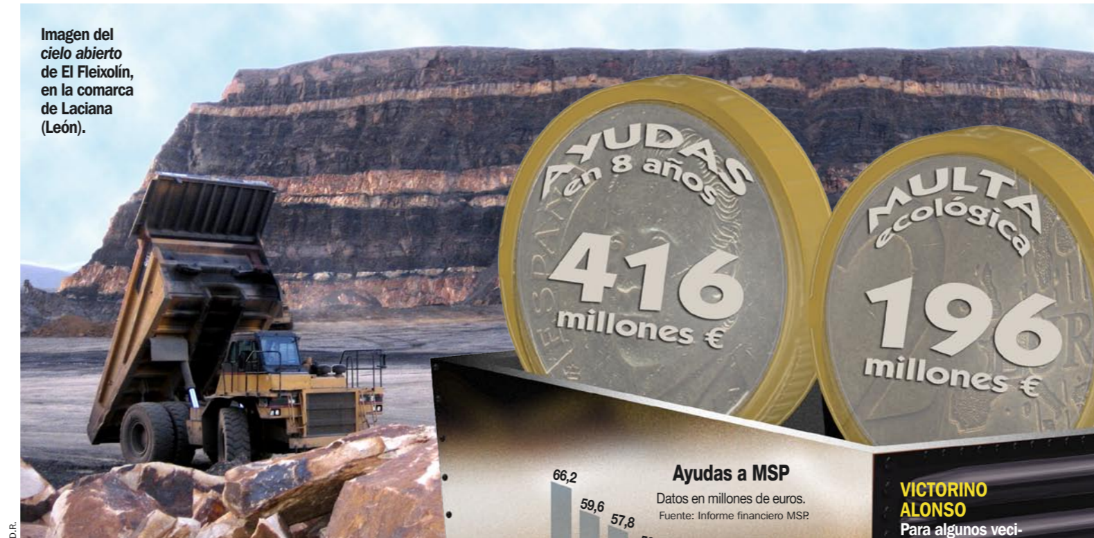
Imagen del cielo abierto de El Fleixolín, en la comarca de Lacia-na (León).