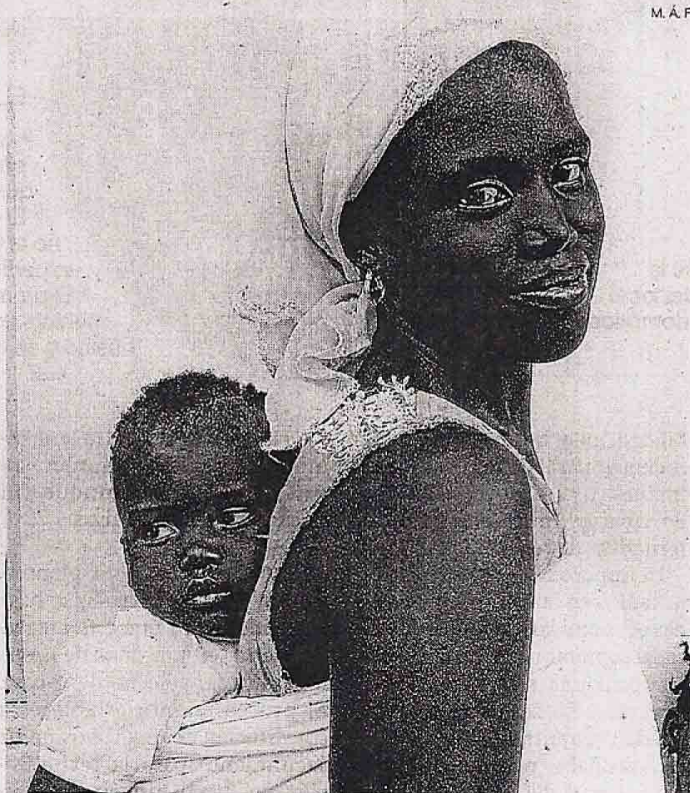
►► Una joven de Touba posa con su bebé.