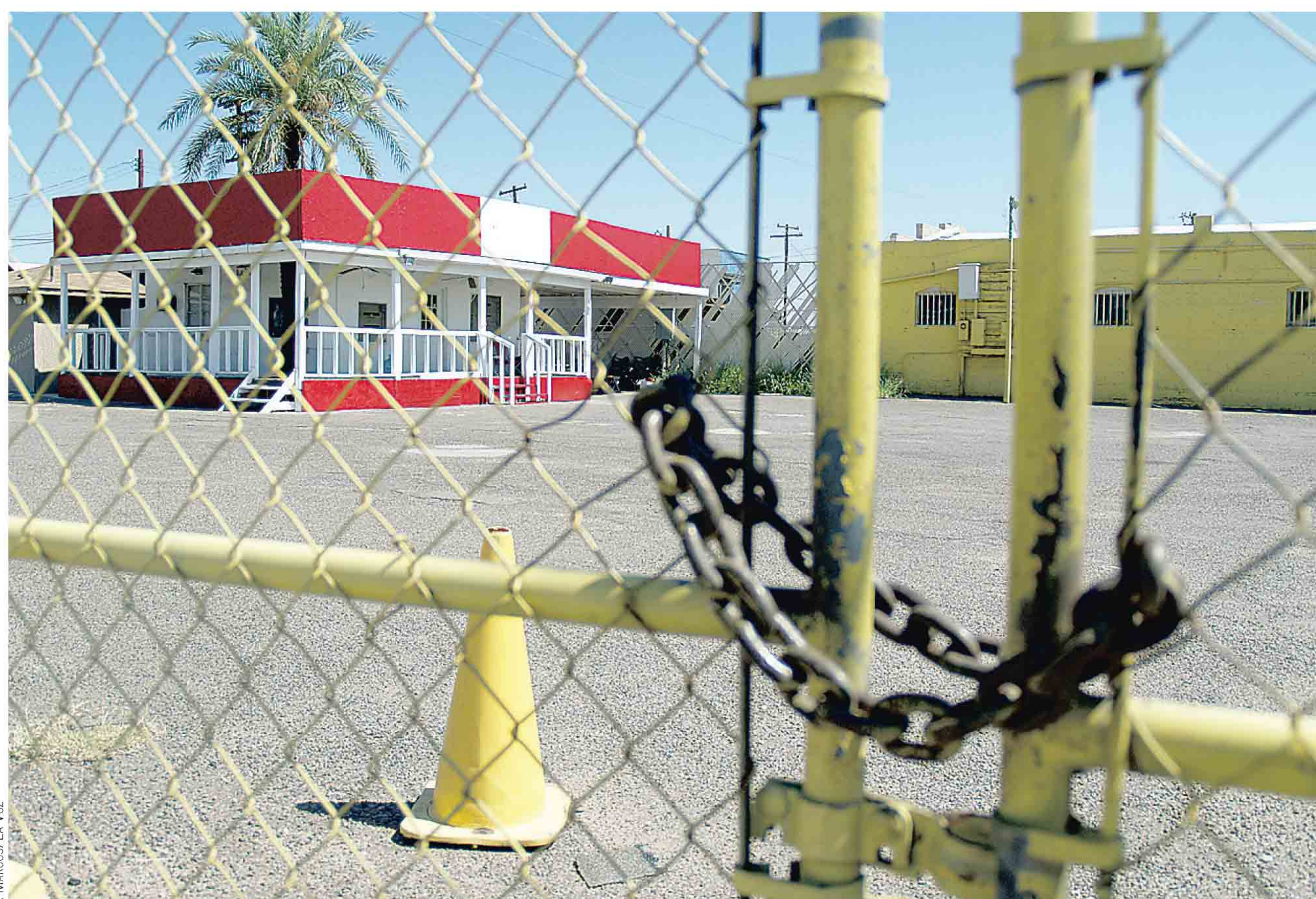
LA ANTES DINÁMICA ZONA DE LOTES DE VENTA DE AUTOS USADOS EN LA CALLE VAN BUREN DE PHOENIX SE HA IDO TORNANDO SOLITARIA.

Los últimos años de su vida los pasó entre su residencia de Coyoacán, en la Ciudad de México, y su casa en Newport Beach, y dedicó gran parte de su tiempo a fundar la Estancia Infantil de la ANDA (Asociación Nacional de Actores), para cuidar a los hijos de los actores. Falleció el 11 de abril de 1983 en New Port Beach.